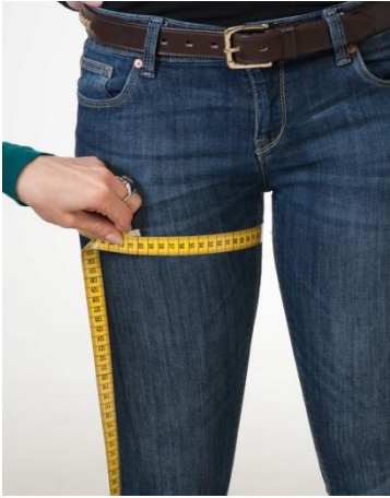
13) Reiden ympäryys: 5cm haarasta alaspäin