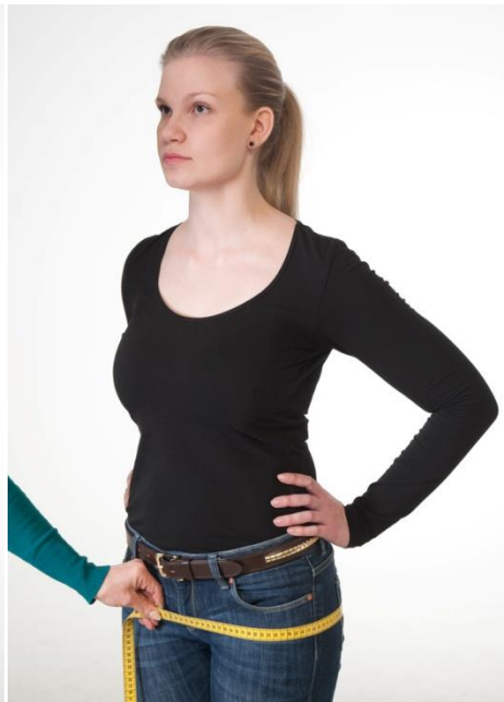
5) Lantion ympäryys leveimmältä kohdalta vaakasuoraan