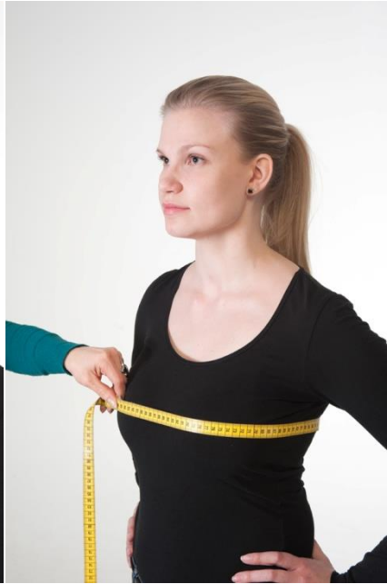
2) Rinnan ympäryys Mittaa vaakasuoraan rinnan leveimmältä kohdalta