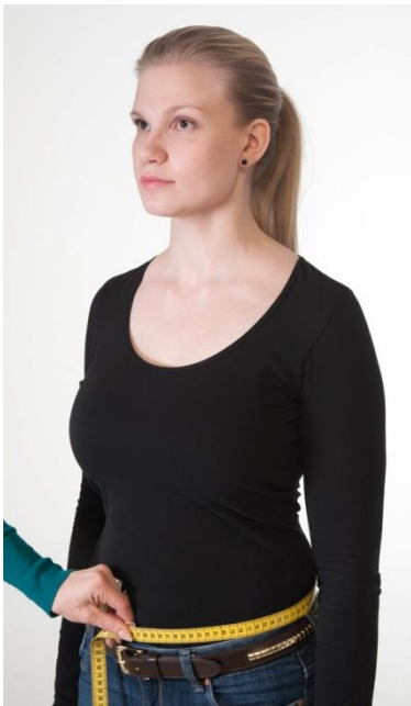
4) Vyörärön ympäryys mitta housun yläreunan korkeudelta housun yläreunan suuntaisesti